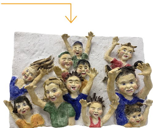
© La joie des enfants (sculpture) - Carmen Warchol

Outre les cours hebdomadaires, divers stages sont proposés pastel, modèle vivant ou portrait... ouverts à tous, que vous soyez débutants ou confirmés.