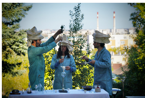
Parcours archéographiques «Elixirs de terrain» dans le cadre du festival «Mur murs» à Ivry-sur-Seine Septembre 2023