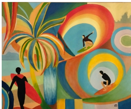
© Ride the Wave (huile)- Nicole Chardon

En cette année où le sport est à l'honneur, ils ont choisi d'explorer le thème « les Jeux Olympiques ».