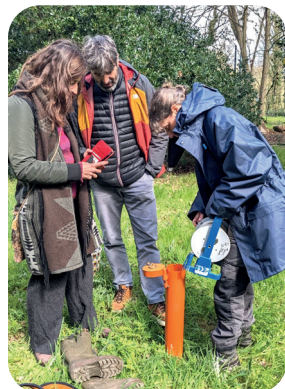
© des ricochets sur les pavés

Peut-être les verrez-vous chercher et répéter en juin prochain ?